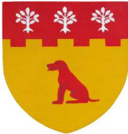
D'or au chien assis de gueule Au chef bastillé de même chargé de trois chênes d'argent